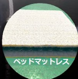
ベッドマットレス